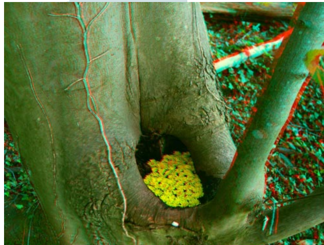
Landartseminar 2011: 3D-Foto, mit rot-grün Brille zu betrachten

Der Ablauf des Kurses ist direkt in der Arbeit mit Kindern und Jugendlichen umsetzbar. Kreatives bildnerisches Handeln und Naturerleben wird so mit aktueller Medien-